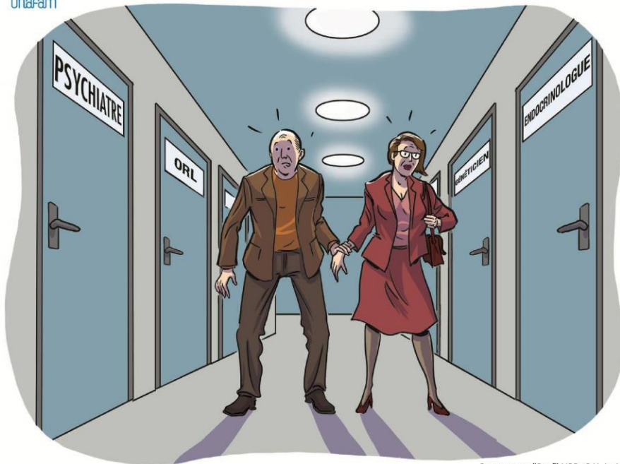
Programme "Bref" UPP -C.H. Le Vinatier